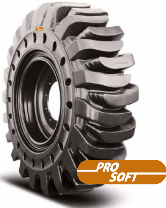
HPS Solidflex Traktion