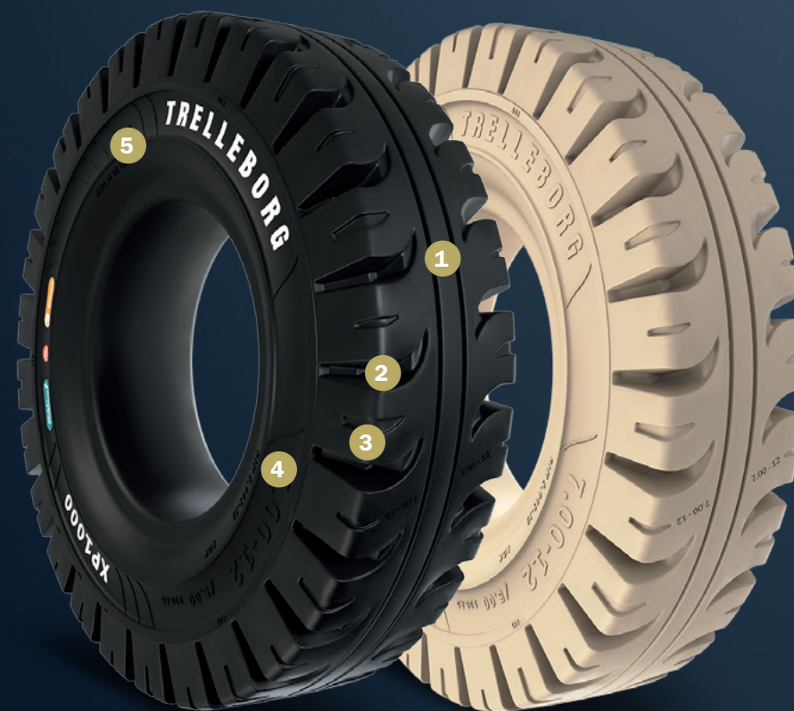
Patentirani dizajn šablona